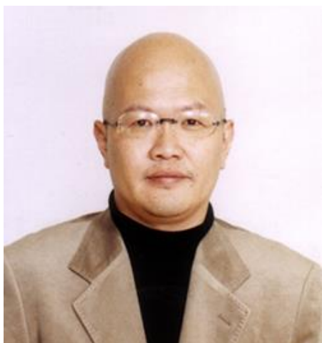
阪南大学教授／流通学部流通学科 大学院 企業情報研究科

●船場出身の経営財政学者、 桜田先生。「カジノ」万博をど う考えるか大いに語ります